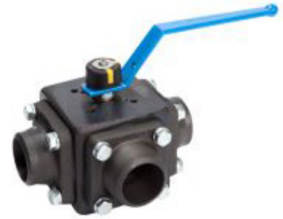
Tryk- og temperaturlabel: