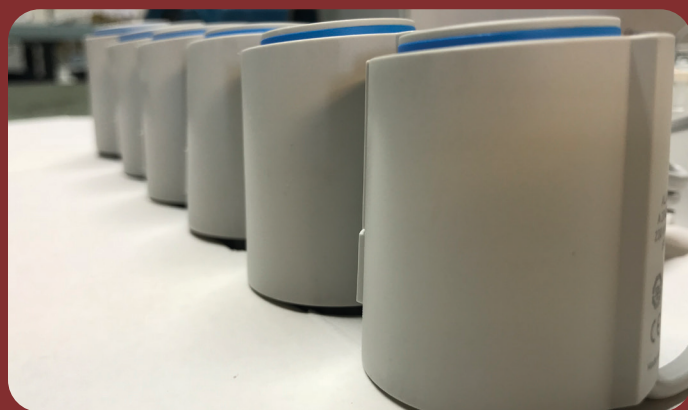
- alt er mærket op, så det er enkelt og nemt at montere og installere!