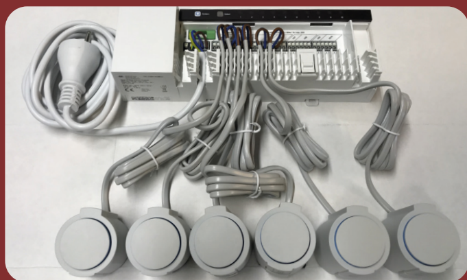
Eksempel: 10 kreds styreboks med 6 telestater

UD af æsken OP på væggen - DU sparer tid ved installation!