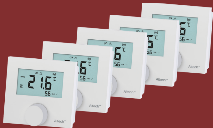
- fem rumtermostater er kodet til styringsboksen og lige til at sætte op i de enkelte rum