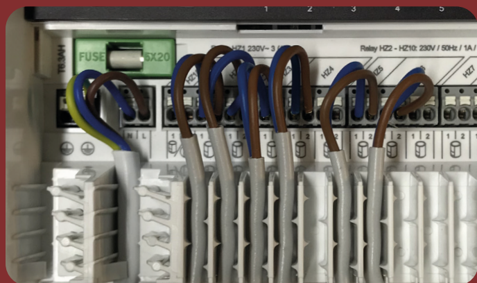
- telestaterne er ledningsført til styreboksen